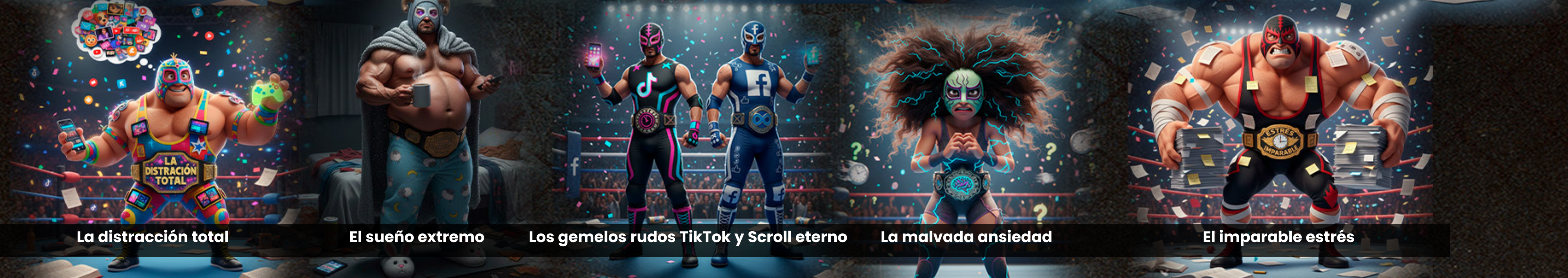
El imparable estrés